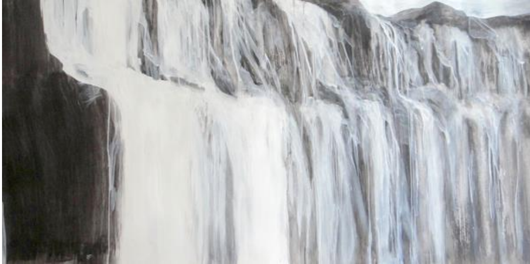
Jihee HAN (Née en 1985)

10, passage Verdeau - 75009 Paris 06 24 48 23 82 www.galeriekf.com