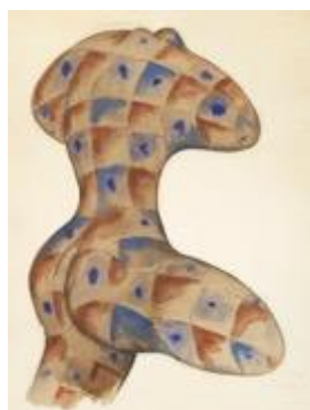
Augustin CARDENAS (1927 – 2001)