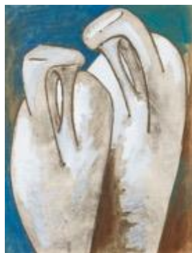
Augustin CARDENAS (1927 – 2001)

14, rue de la Grange Batelière - 75009 Paris 01 45 23 41 16 galerieab@gmail.com / www.galerieab.fr