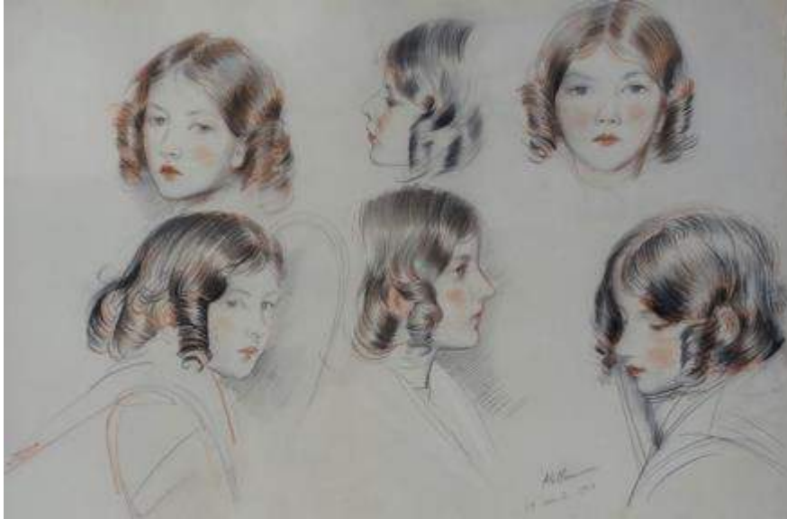
Paul Cesar HELLEU (1859-1927)