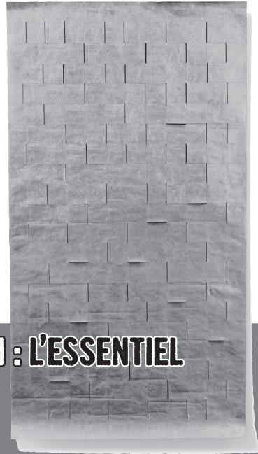
« Blinding Light », Zarina Hashmi, 2010.