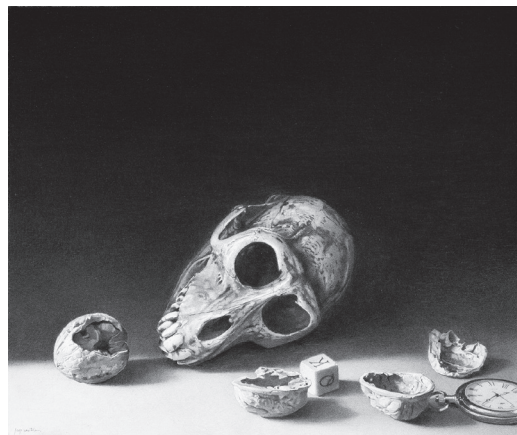
« Vanitas de l'atzar », Josep Santilari, 1959.

4 • Pariscope • semaine du 30 mars au 5 avril